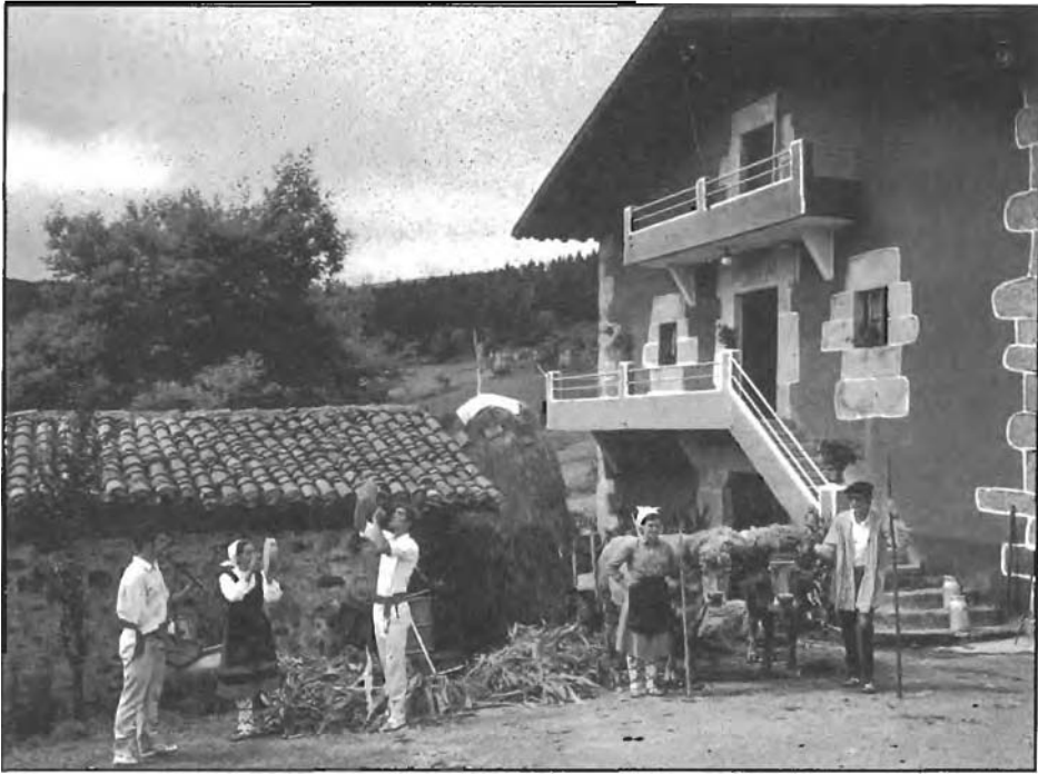
Lan eta arlu-emonetan