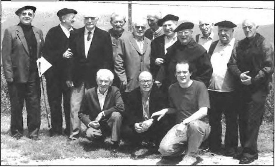
Euskerazaintza, Euskerearen argia