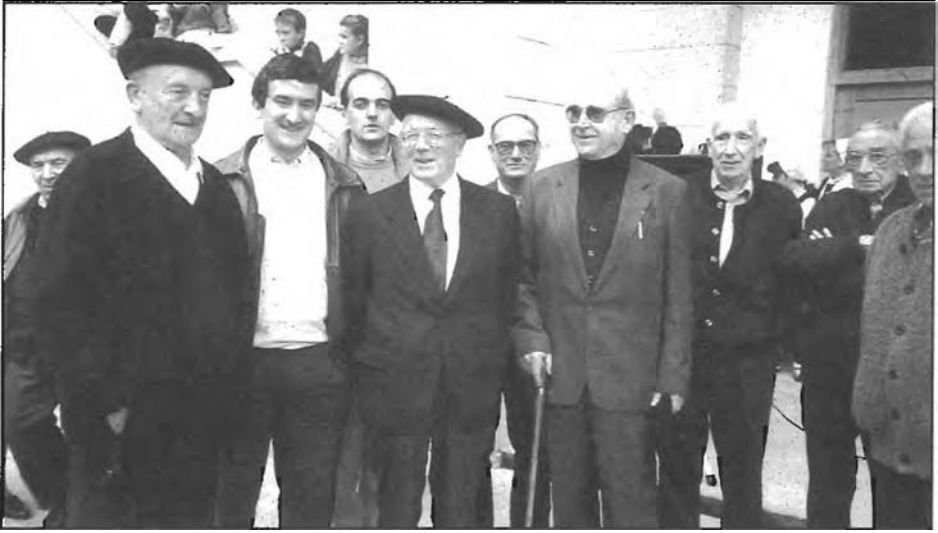
Euskaldunak eta adiskideak izkuntza-lanean