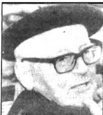
Jose Migel Barandiaran, Abade giza-iztilaria