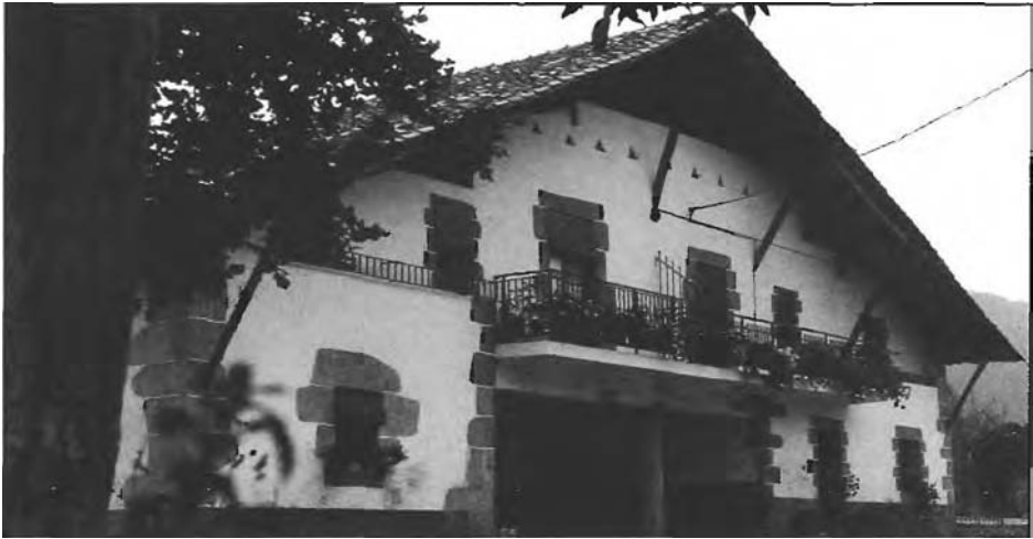
Eusko basetvea bakean