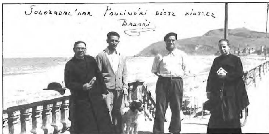
"Basarri. iLvaropena. Ryan" Kristau-Ikasb' de ta Euskerearen Burrukan